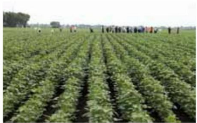
Дан поља Дунав Соје у Лугову

Удружење Дунав Соја, Пољопривредна стручна служба из Сомбора и компанија Agri Business Partner организовали су Дан поља одрживе производње соје, 14. јуна у Лугову, који је окупио око 200 највећих произвођача соје из земље и региона. Обележавању Дана поља су присуствовали представници домаћих прерађивачких капацитета, контролних кућа, извозника и приказан је најбољи сортимент соје, машине за механичко сузбијање корова, комбинације примене средстава за заштиту биља и примена фолијарних ђубрива у производњи соје. Дунав Соја Дан поља је један од 10 догађаја широм Европе на којима је обележено 140 година производње соје и истакнут значај контролисаног БЕЗ ГМО квалитета и домаћег порекла соје и за производњу хране, пре свега меса, млека и јаја.